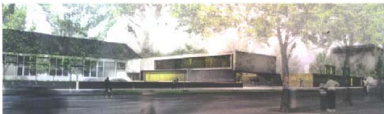
Le Pôle universitaire briochin