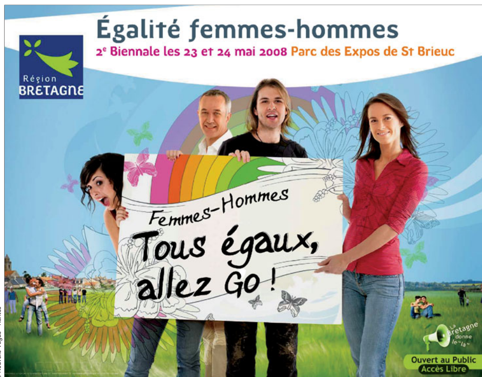
La Région a choisi le parc des expositions de Saint-Brieuc pour cette deuxième biennale.

Il sera donc beaucoup question de femmes, mais c'est bien un rendez-vous proposé à tous les citoyens et aux familles qui est proposé, avec des