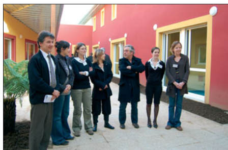
Une partie de l'équipe pluridisciplinaire, dans l'agréable patio de cette unité fermée.

L'équipe de soins de Saint-Jean-de-Dieu l'a conçu ces locaux fermés mais confortables, avec des chambres individuelles, un patio, deux salons pour recevoir ses proches, une salle d'activités où l'on réapprend la vie quotidienne, deux chambres dites d'isolement. Ils peuvent aujourd'hui accueillir 20 patients, qui jusqu'à présent devaient aller à Dinan. Le but est donc de proposer rapprocher l'offre de soins de la population briochine, et de passer à 25 lits