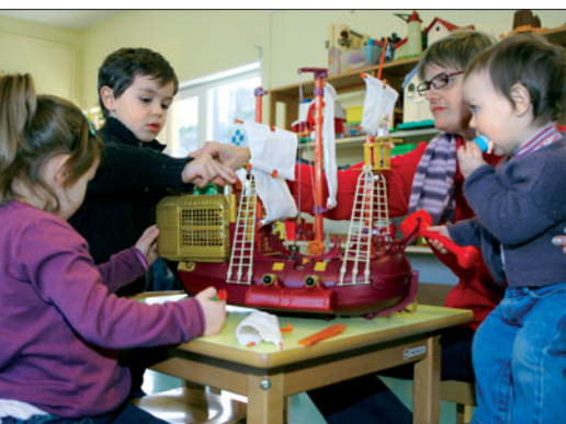
Le bateau-pirate passionne toute la famille.

• Ludothèque, La Toupie, du lundi au samedi. 02 96 62 56 72. Fête du jeu le 31 mai de 14h30 à 18h au Chat Perché et Espace Croix Saint-Lambert.