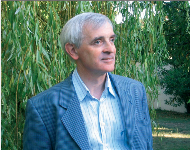
Jean Jouzel sera le président d'honneur de Terralies.

Pour cette nouvelle édition, Terralies a choisi pour thème phare le réchauffement climatique. L'événement de ce salon de l'Agriculture des Côtes d'Armor sera la venue du climatologue et glaciologue breton Jean Jouzel, membre du GIEC (Groupe intergouvernemental d'experts sur l'évolution du climat), à ce titre prix Nobel de la Paix au côté d'Al Gore en 2007. Il donnera une conférence en ouverture le 30 mai.