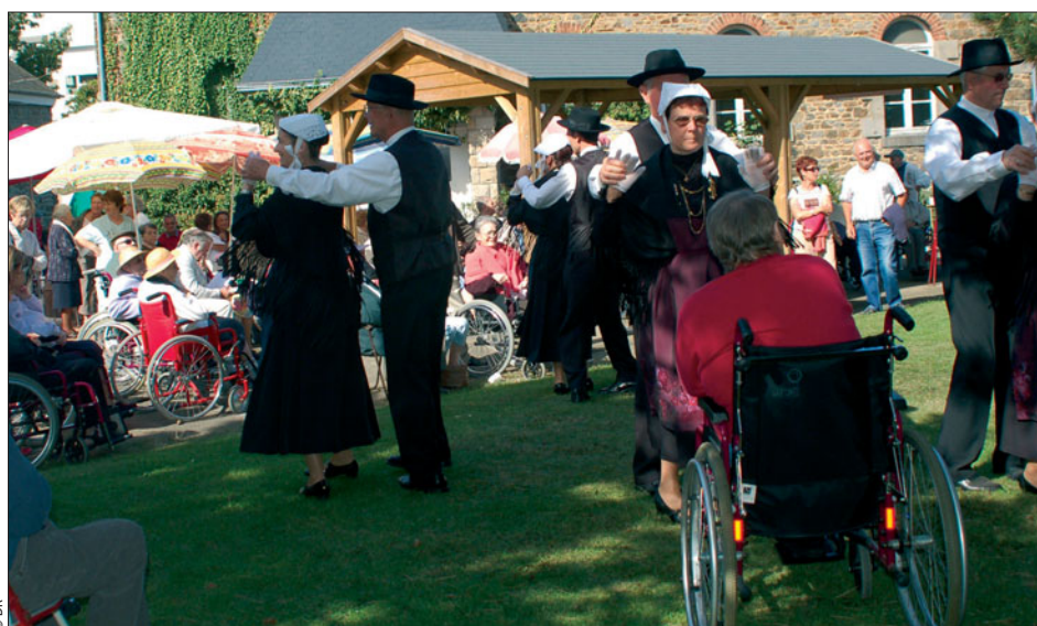
Lors d'une précédente fête, toujours un bon rayon de soleil pour les Capucins.