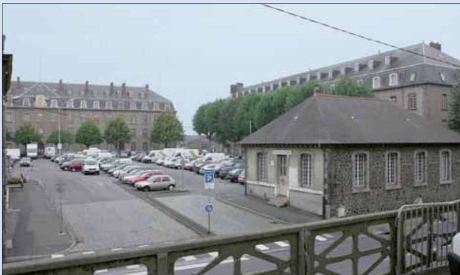
A l'avenir le site sera ouvert sur le centre-ville.

En réalité, le choix est simple entre l'ambition d'une stratégie qui accroît les chances de développement de notre cité et la résignation d'une position de repli qui, sous prétexte d'orthodoxie financière, conduit au déclin assuré et à un avenir compromis.