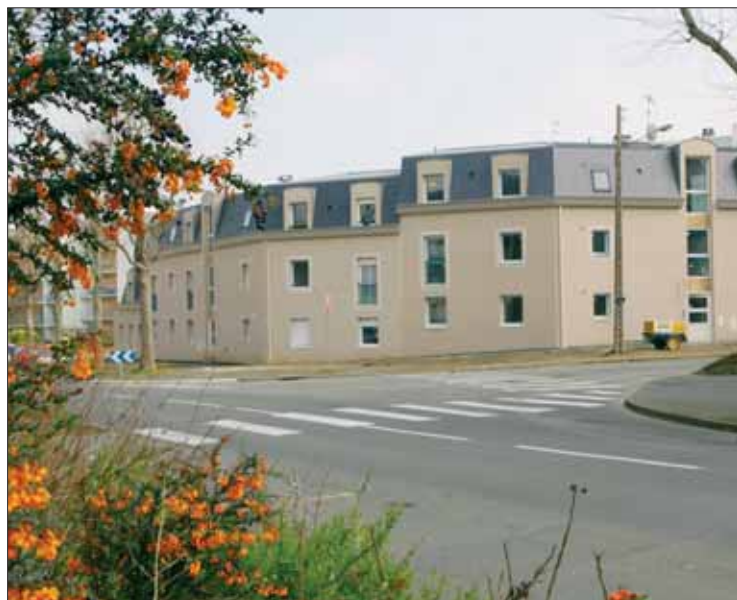
Le nouveau programme avenue Loucheur sera terminé en mai.