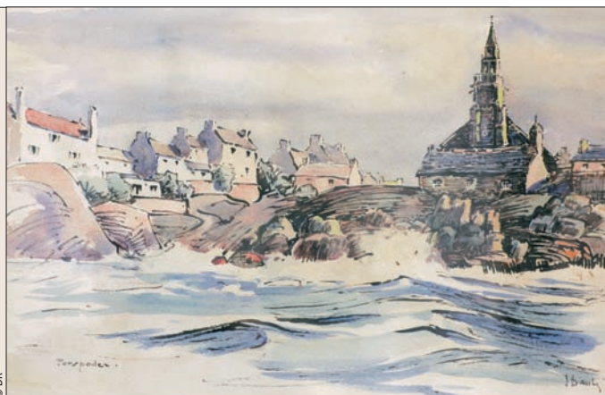
Une vue de Porspoder, aquarelle d'Émile Daubé.

Par ailleurs, une partie de l'exposition rend hommage à Émile Daubé, premier conservateur du musée (de 1943 jusqu'à sa mort), en présentant quelques-unes des œuvres qu'il a fait entrer dans les collections. Enfin, sur le chevalet de l'artiste, le public pourra admirer la dernière œuvre du « Père Daubé » : une vue inachevée du port du Légué.