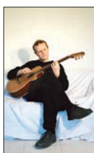
Mayra Andrade ▶