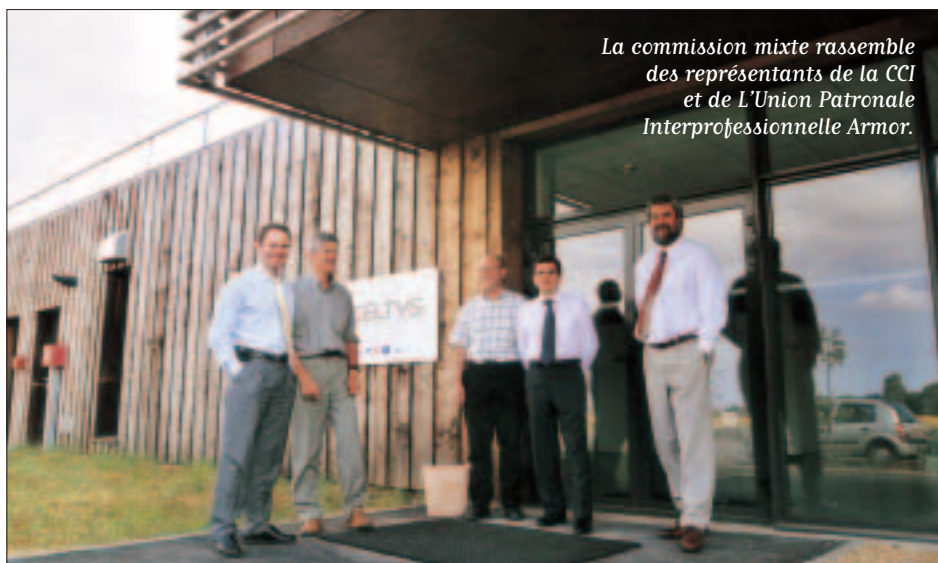
La commission mixte rassemble des représentants de la CCI et de L'Union Patronale Interprofessionnelle Armor.