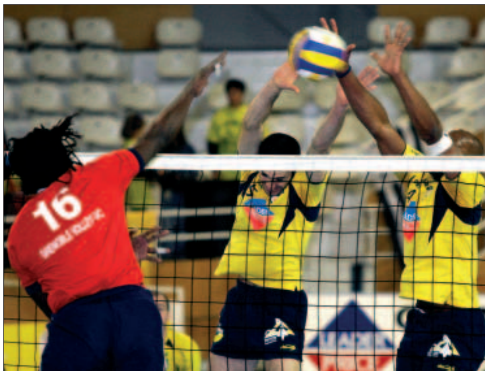
Le Saint-Brieuc volley fête son retour parmi l'élite. Premier match à domicile le 23 septembre prochain contre l'équipe de Tours.