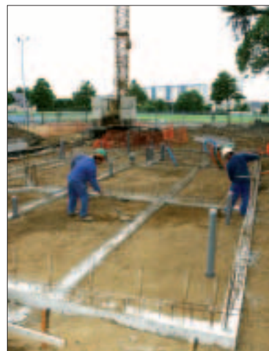
Les travaux des futurs vestiaires ont débuté au stade Hélène Boucher.

Centre de voile : aux Rosaires, un accueil pour le public est aménagé, avec un comptoir à l'entrée, et une terrasse pour l'espace glisse adultes. Une station météo est installée.