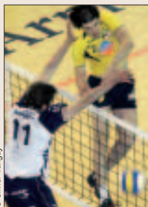
« Le sport de haut niveau, une vitrine pour la ville. »

plus grand nombre, notamment les jeunes, pour leur bien-être physique et moral. Le sport est un facteur de cohésion sociale, c'est une fête, c'est aussi une école de la vie. On y apprend le goût de l'effort, du dépassement. Je considère aussi que le sport de haut niveau tire tout le monde vers le haut. Cette saison, on a par exemple le volley qui accède à la Pro A, Saint-Brieuc Basket en N3, des gens comme Yann Élies qui nous font rêver. Le sport doit être une vitrine pour la ville, refléter son dynamisme. »