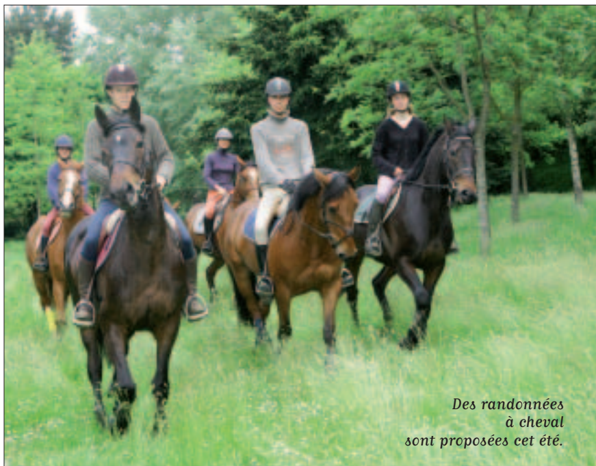
Des randonnées à cheval sont proposées cet été.

des épreuves de natation, course, VTT, rando dans la baie. La carte Pass donne gratuitement accès à un parcours d'activités. Les clubs proposent baptêmes et démonstrations. Le service municipal des Sports et l'office du sport met-