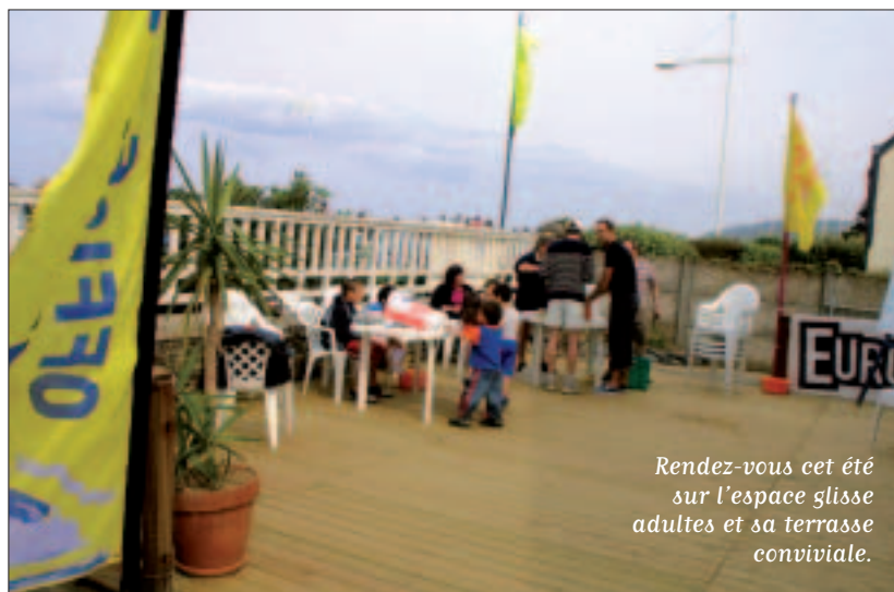
Rendez-vous cet été sur l'espace glisse adultes et sa terrasse conviviale.

• Contacts : Service municipal des Sports, 15 rue Vicairie, 02 96 62 55 17 - Office du sport, rue Poulain-Corbion, 02 96 62 56 66. Programme détaillé en page 34-35.