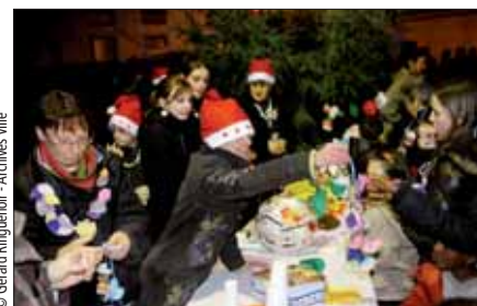
© Gérard Ringueur - Archives Ville

• Centre social Point du Jour, 0296944384.