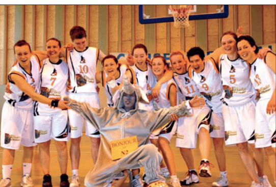
Les filles ont décroché leur billet pour la N2 !