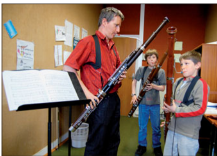
Des cours de basson au Conservatoire.

• foudebasson.fr . Conservatoire, 02 96 94 21 65