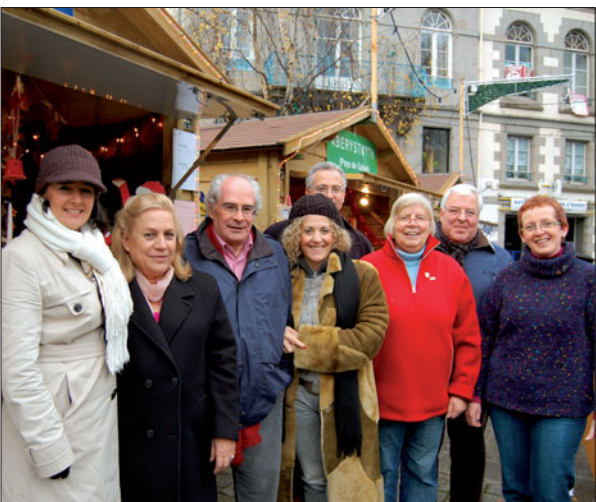
Lors du marché de Noël, Allemands, Gallois et Grecs étaient ravis de témoigner de leur amitié auprès des Briochins.

• Comité de Jumelage, tél. 02 96 62 54 53.