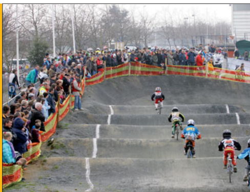
La médaille de Laëtitia fait rêver les jeunes, de plus en plus nombreux à rejoindre le Saint-Brieuc BMX.

Quarante quatre ans après Maryvonne Dupureur sur 800 mètres aux Jeux de Tokyo, Laëtitia Le Corguillé remporte elle aussi l'argent. C'était le 22 juillet dernier sur la piste de Pékin.