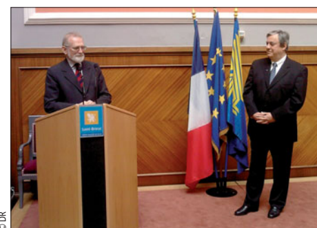
Bronislaw Geremek en mairie en avril dernier.

« J'avais souhaité qu'il puisse inaugurer le boulevard Robert Schumann à Saint-Brieuc, en raison du symbole qu'il représentait et qu'illustrait son engagement profond dans son combat permanent pour une Europe unie, libre et humaine. La réception qui suivit à l'hôtel de ville fut un moment exceptionnel qui constitue aujourd'hui un émouvant et inoubliable souvenir. Sa force de conviction, sa profondeur d'âme, sa grande culture et son attachement à la liberté, inspiraient l'intervention qu'il formula dans un « message de bonheur et d'optimisme » qui résonne en ces jours de tristesse comme un signe d'espoir pour la construction et le rayonnement de l'Europe de la paix, de la liberté et de la fraternité ».