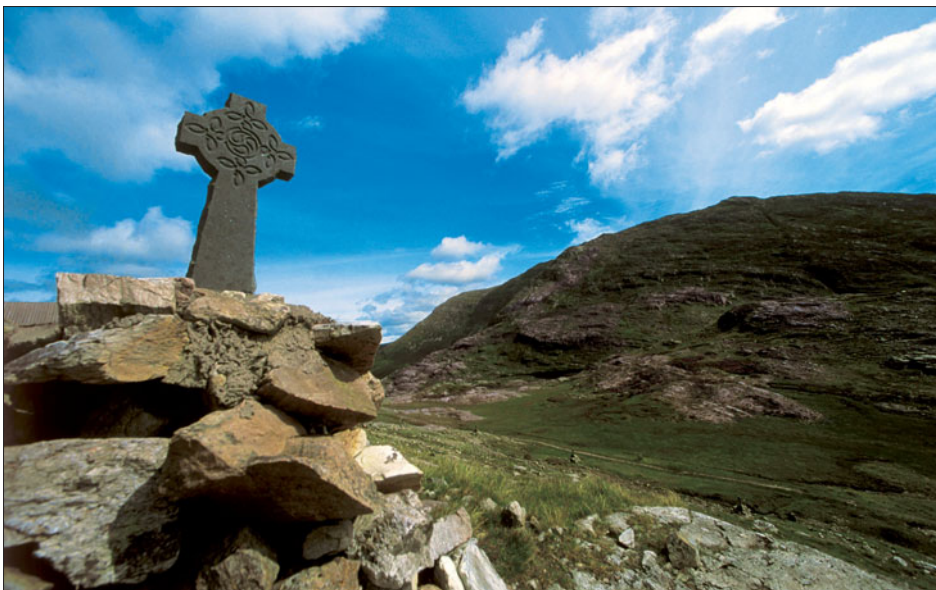
L'Irlande offre toujours de splendides paysages.

• Foire Exposition des Côtes d'Armor, du 13 au 21 septembre de 10 h à 19 h au parc des expositions de Brézillet. Entrée 5,50€, 4 € pour les 12-18 ans et les étudiants, gratuité pour les moins de 12 ans accompagnés et pour les personnes handicapées, tarif spécial pour les plus de 65 ans. 02 96 01 53 53.